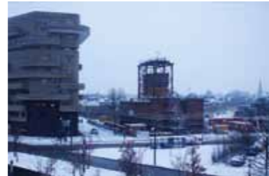
29 november 2010, 17:07 uur.