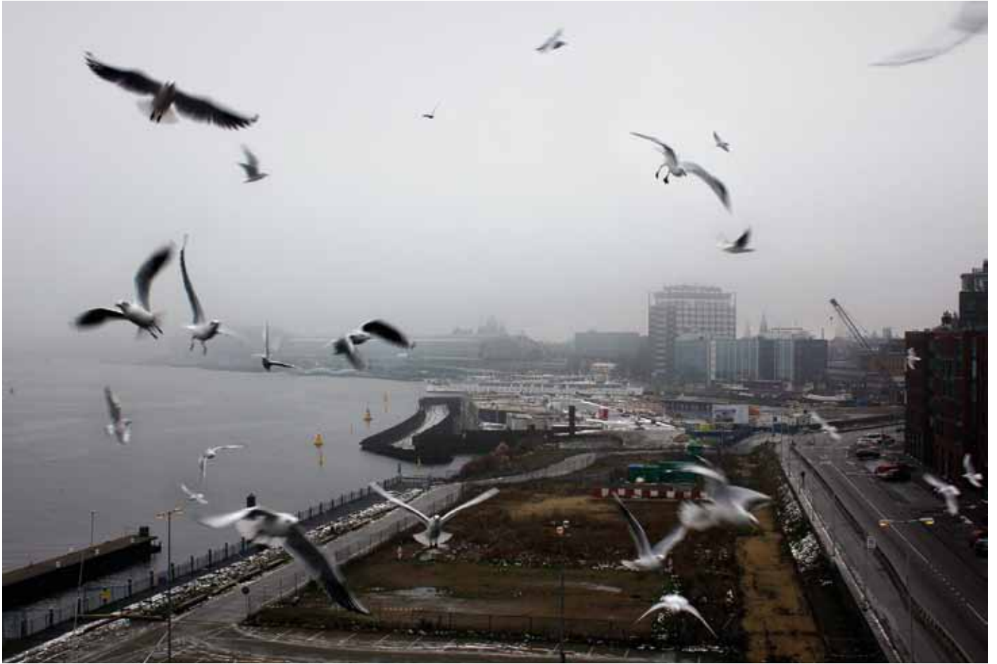
31 december 2010, 17:00 uur.