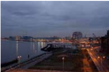
Westerdoksdiik. 31 december 2010, 13:12 uur.