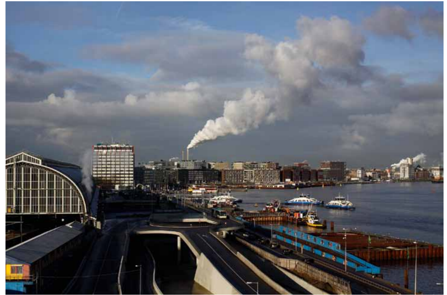
25 december 2010, 10:46 uur.

ben ik het zelf maar gaan doen. Als ik het bijna af heb kan ik het aanbieden. Het is een belangwekkende klus die vastgelegd moet worden voor het nageslacht. Dat is waar fotografie eigenlijk voor is, niet-waar? Gelukkig vond ik daar ook snel een plek, bij het advocatenkantoor Beer op de Weteringschans aan de overkant. Zij sponsoren mij met een vierkante meter en elektriciteit. Als je de problemen die je onderweg tegen kan komen onder de knie hebt, dan heb je een ervaring waarmee je zo’n opstelling vlug kunt opzetten. Een week of zes geleden kwam het architectenbureau van het Cremer Museum met de vraag of ik eenzelfde klus wilde doen bij een project waarvan zij het stedenbouwkundig plan hebben gemaakt, aan de Westerdoksdijk. In de loop van de komende veertien dagen hoop ik daar een camera te hebben. Het onderwatergedeelte is al gebouwd en spoedig komen daar nu ook de hijskranen. Ik heb een