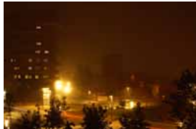
26 september 2010, 05:29 uur.