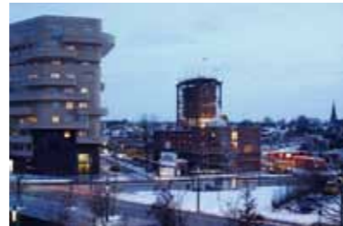
30 november 2010, 17:50 uur.

waaronder ik kan fotograferen. Die wordt bepaald door de plek waar ik het kastje van de camera kan plaatsen, een waterdichte nis. Dat is op elke plek anders. Het kan nogal wat zoek- en praatwerk kosten om bewoners van appartementen of huurders van kantoren te overreden om te sponsoren. In Enschede staat de camera op het dak van het appartementengebouw dat tegenover het bouwwerk voor het Cremer Museum staat.”