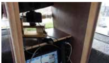
Het schoonmaken van de ruit, de camera en het interieur van de kast.

"Dit was het eerste project, een filmpje gemaakt van foto-opnamen met een tussentijd van zo'n vijf minuten, met een digitale camera die op een afstandje van het bouwwerk staat, en op afstand bediend kan worden met mijn smartphone. Wisselend weer kan natuurlijk tegenwerken. Als dat ongunstig is gebruik ik de opnamen niet, net zoals ochtend- en avondlicht en tegenlicht. En de nachten knip ik er uiteraard uit. De camera staat in z'n eigen niche, een waterdichte kast die daar speciaal voor is gebouwd, met zware huf-terproof kabels voor de elektriciteit en de connectie met internet," aldus Guntenaar. De eerste time-lapse film heeft twee jaar fotograferen gekost. Die lange tijdsduur wordt uiteraard bepaald door de lange duur van de bouw. Voordat de bouw start begin ik met het zoeken naar de hoek