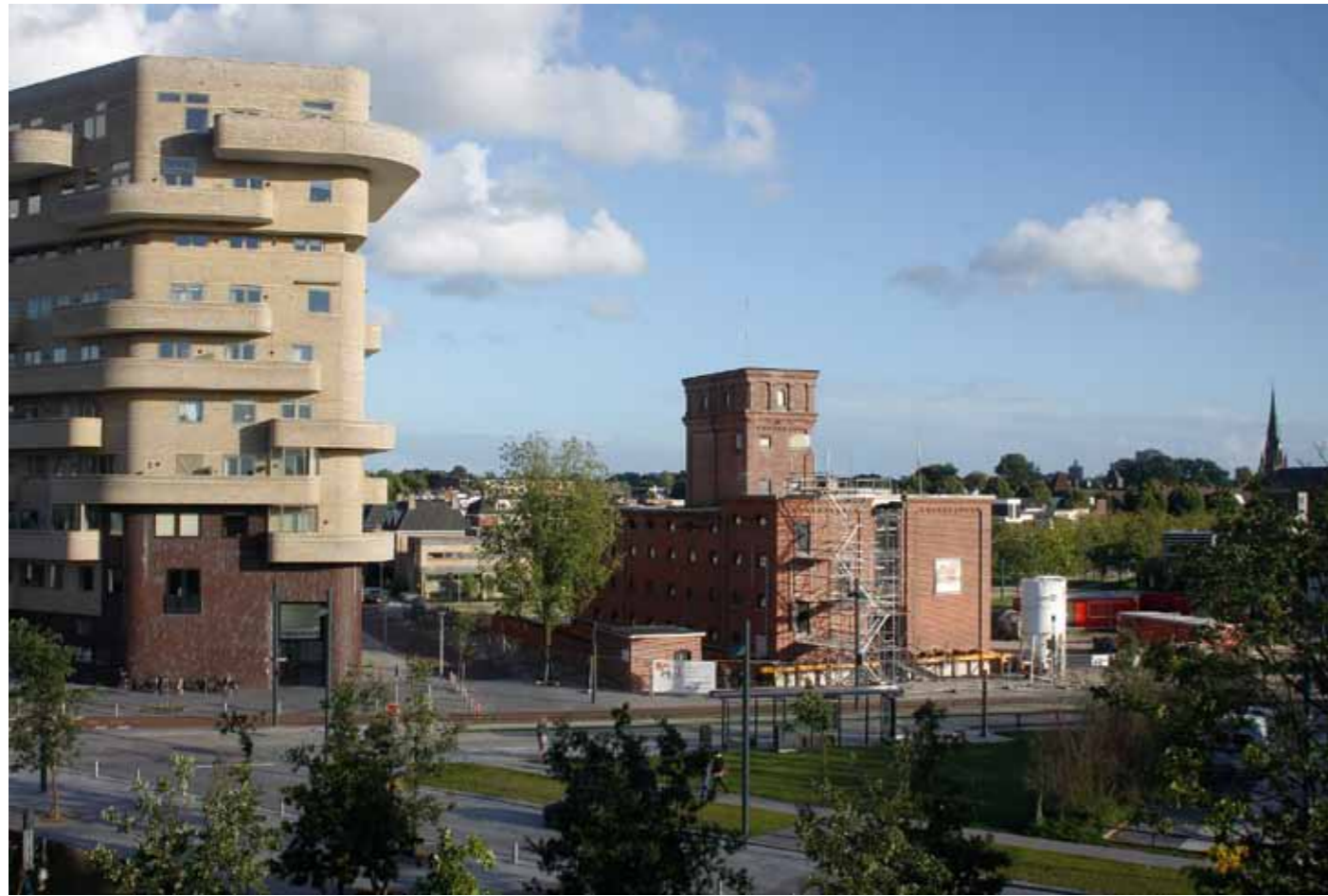
Jan Cremer Museum in de middagzon. 25 september 2010, 17:54 uur.