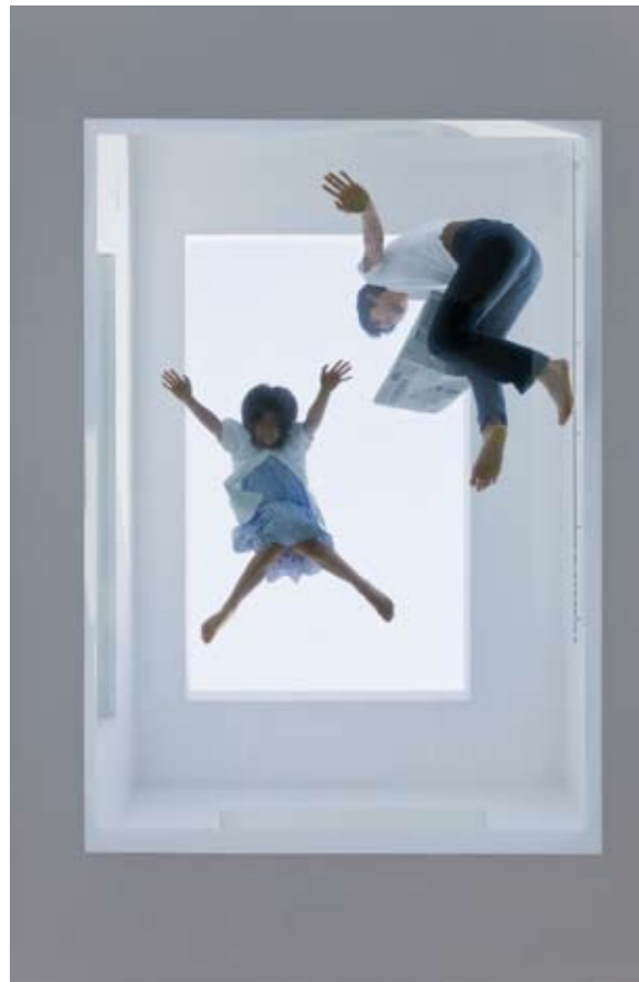
Ondersteboven in House N, Sou Fujimoto Architects, Oyta, Japan, 2009.