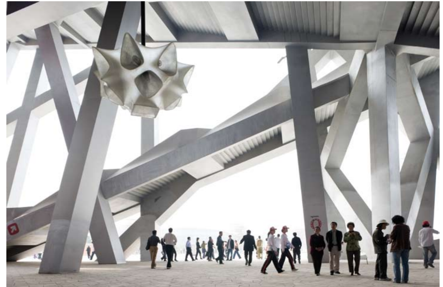
De eerste bezoekers van het National Stadium Beijing van Herzog & De Meuron architecten, even voor de officiële opening, 2008.