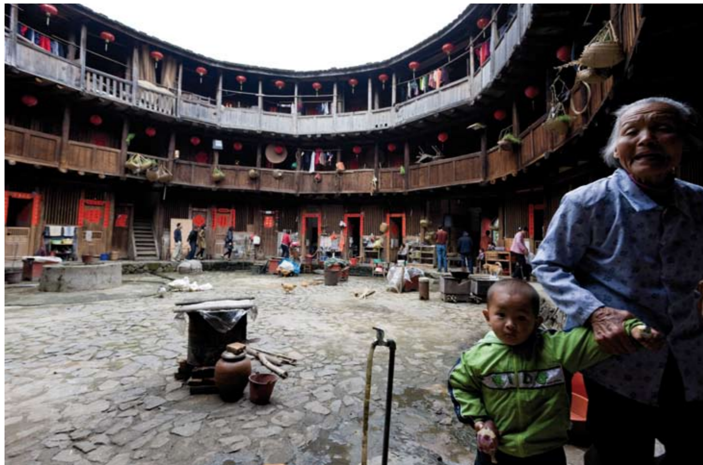
Samenleving van generaties in de Historic Tulou Housing in Yongding, China.

greep terug naar die bouwstijl. Hij had huizen gebouwd voor mensen uit de lage inkomensgroepen, hetgeen heel bijzonder is in China. "Om dat verhaal compleet te maken, heb ik de oude gebouwen gefotografeerd en heb ik het leven in de nieuwe gedocumenteerd."