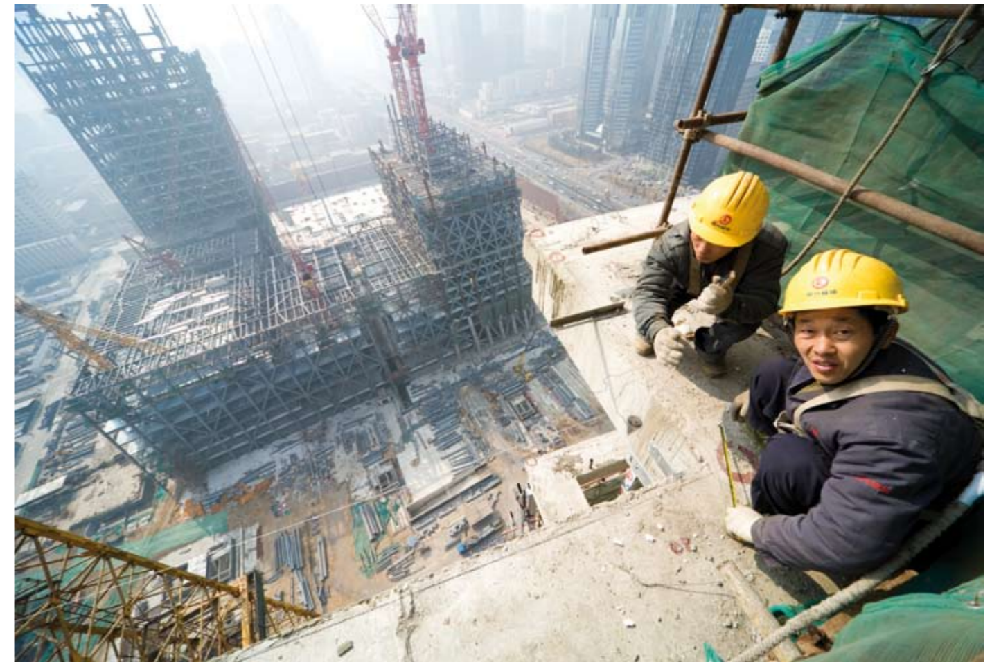
Arbeiders checken de correcte verticale lijn van de constructie van het gebouw van de CCTV, OMA, 2006.