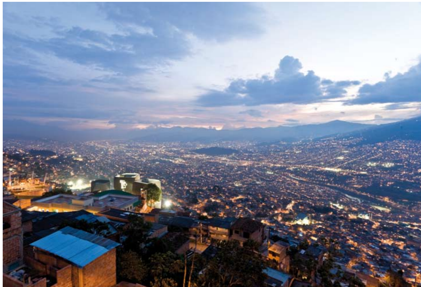
Een nieuwe bibliotheek, the Bibliotheca España ontworpen door Giancarlo Mazzanti in Medellin, Colombia, 2008.